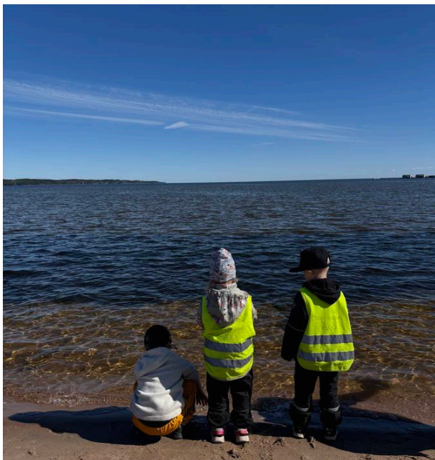
BAMBINI IN USCITA SUL LAGO – IL TERRITORIO COME SPAZIO DI APPARTENENZA

In quel contesto, osservare come i bambini vengono educati non è soltanto scoprire un sistema scolastico. È prendere consapevolezza di una filosofia di vita.