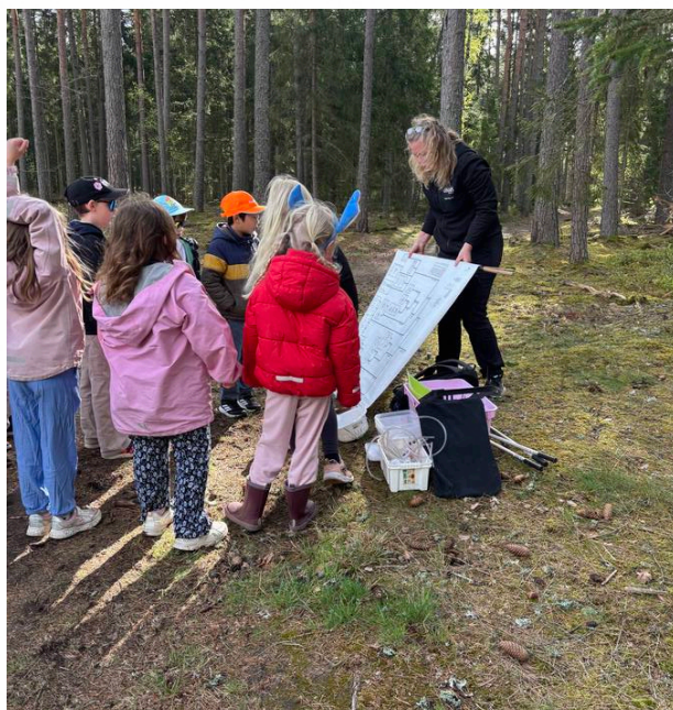
UN'INSEGNANTE GUIDA L'ESPLORAZIONE CON STRUMENTI REALI