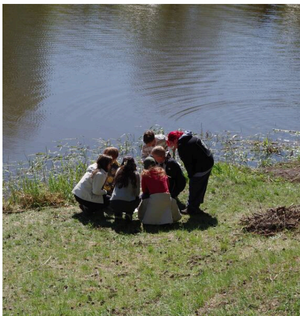
PICCOLI GRUPPI AL LAVORO — LA DIMENSIONE CONSENTE ASCOLTO E PRESENZA

Nei servizi di nido e infanzia, la presenza costante di 4 insegnanti per ogni gruppo di 19 bambini non è un dettaglio organizzativo: è la condizione che rende possibile tutto il resto. Un rapporto che garantisce attenzione, cura e la qualità del legame educativo che si vede in ogni momento dell'esperienza svedese.