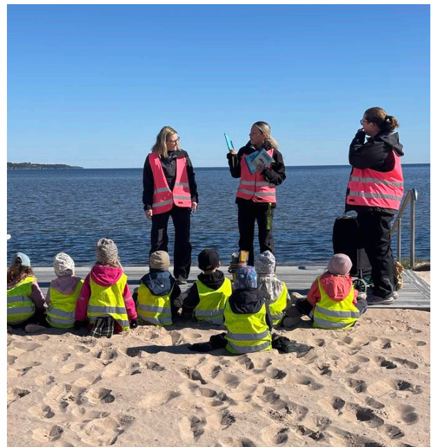
LEZIONE SULLA SPIAGGIA – L'AULA È OVUNQUE SI TROVI IL GRUPPO