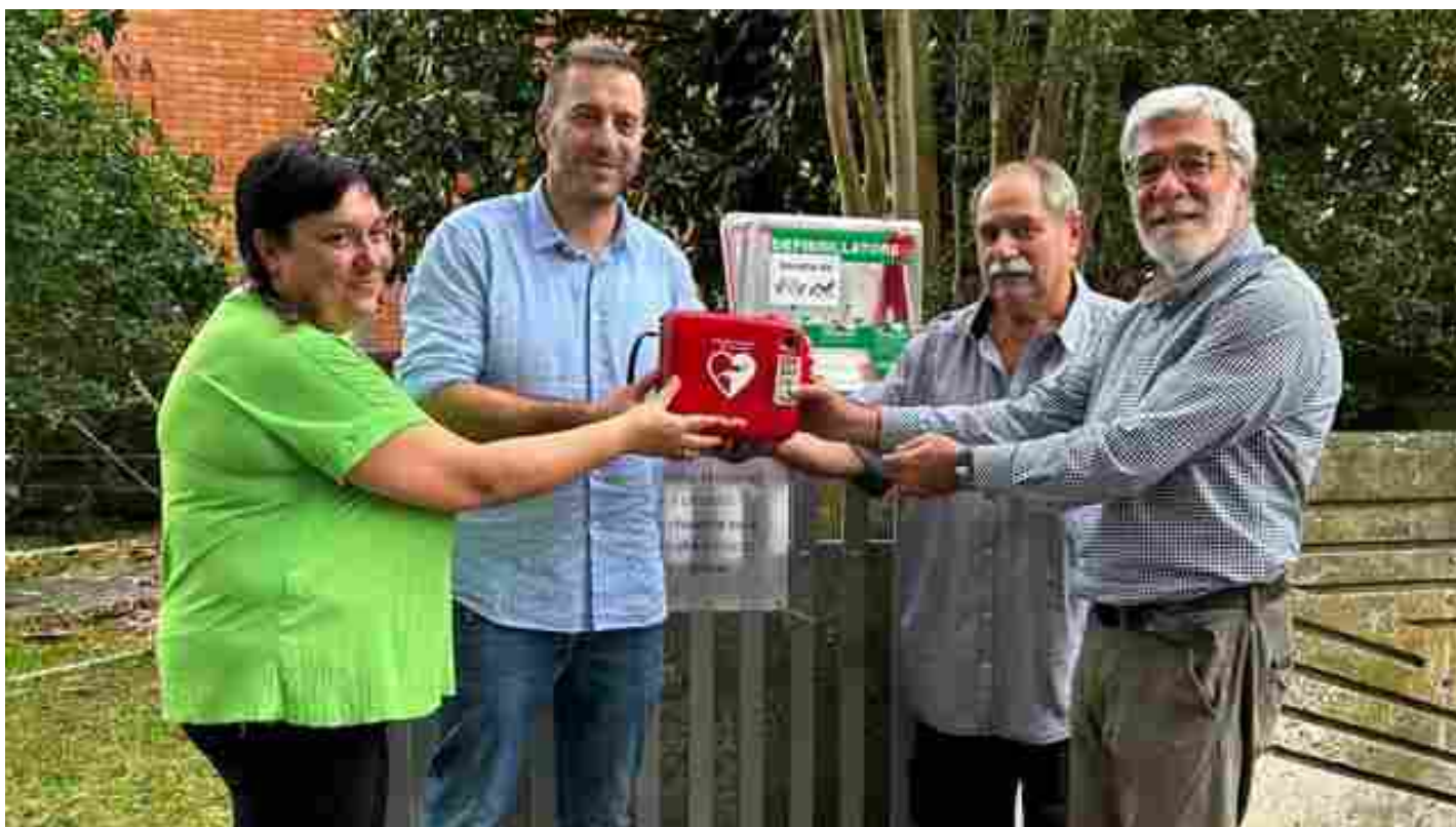
La consegna del defibrillatore

Prosegue la collaborazione tra Fism Ferrara e l'associazione Voglio Volare per la sensibilizzazione nella cura delle patologie cardiache ereditarie e la prevenzione della morte improvvisa per arresto cardiaco. In questo senso, venerdì è stata effettuata la donazione di un defibrillatore alla scuola materna 'Elisa Buscaroli' di Consandolo.