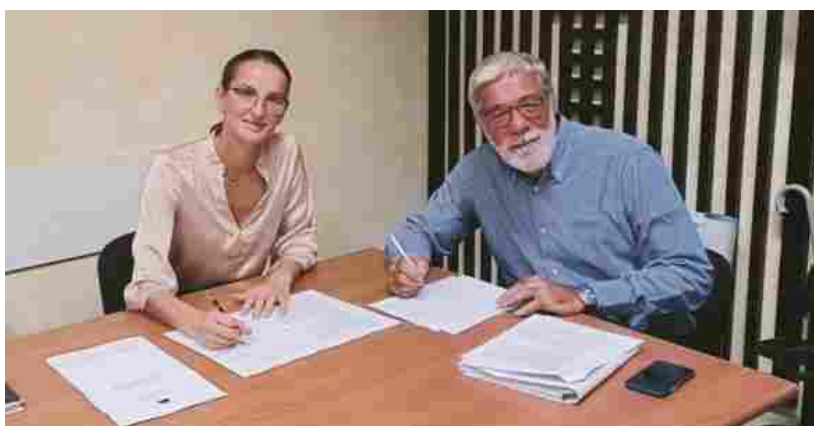
La firma del protocollo