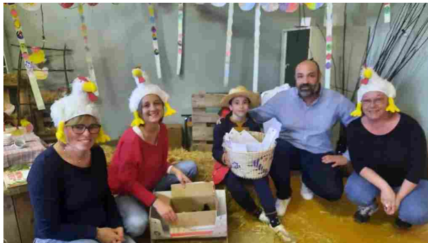
La vita che nasce alla Sacra Famiglia Pulcini per gli alunni

A lla scuola dell'infanzia paritaria 'Sacra Famiglia' di Santa Maria Codifiume, gestita dalla Cooperativa Mondo Piccolo, la Pasqua è arrivata con qualche giorno in anticipo e aveva il sapore della scoperta della vita che nasce. Sono 20 i pulcini che i piccoli alunni dai 3 ai 5